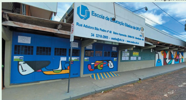
Eseba oferta quatro vagas para estágio

A Escola de Educação Básica da Universidade Federal de Uberlândia (Eseba/UFU) realiza processo seletivo visando preencher quatro vagas para estágio. A oportunidade é voltada para estudantes dos cursos de licenciatura. As inscrições estão abertas até o dia 22 de janeiro.